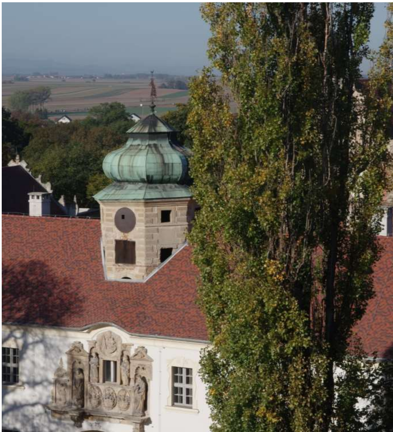
Schlossportal Oberglogau / Portal zamku w Głogówku

Historische Kommission für den Kreis Neustadt/OS e.V. Komisja Historyczna Powiatu Prudnickiego