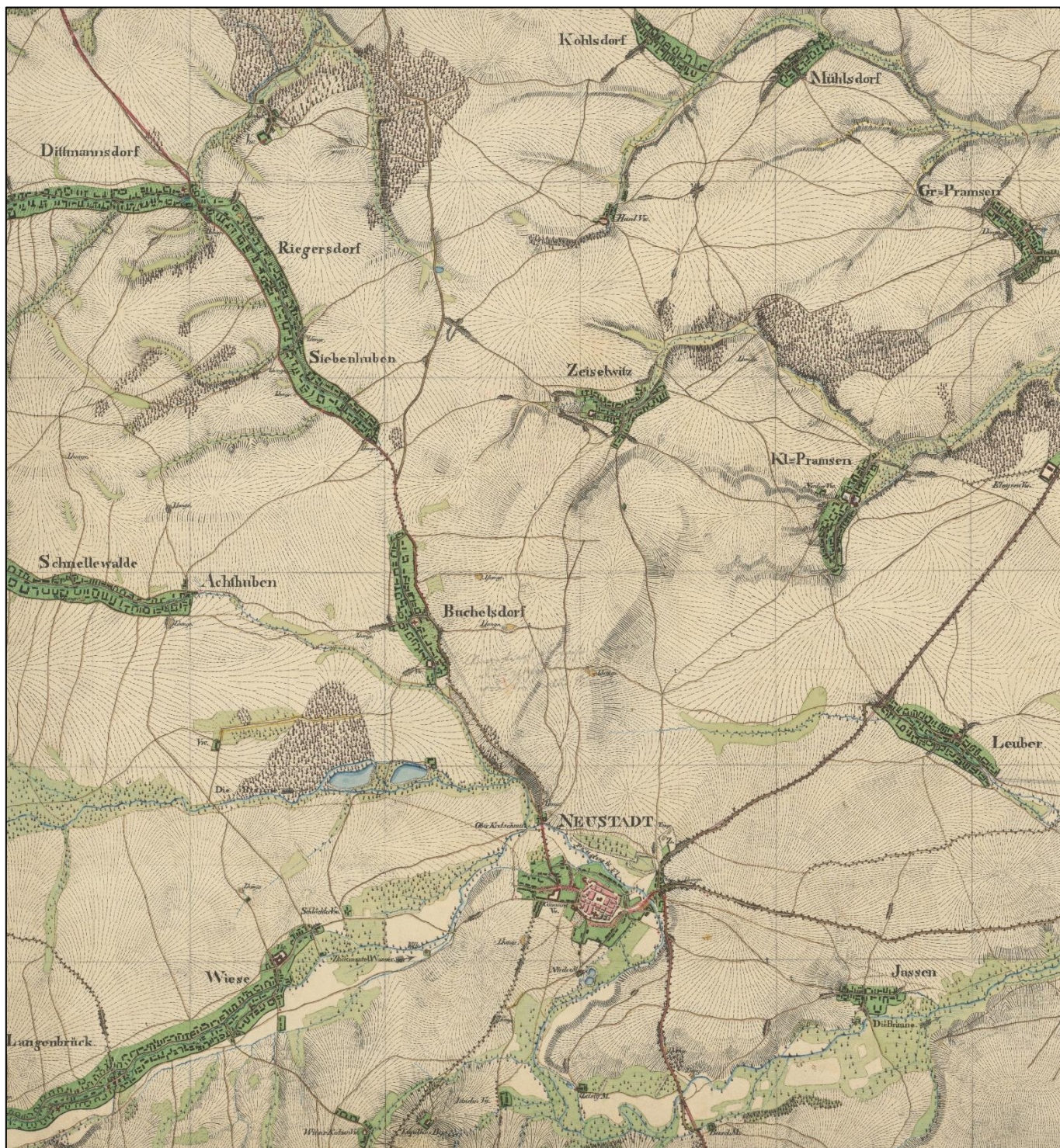
Urmeßtischblatt „Neustadt“ von 1825 / Mapa topograficzna „Neustadt (obecnie Prudnik)” z 1825 roku

Historische Kommission für den Kreis Neustadt/OS e.V. Komisja Historyczna Powiatu Prudnickiego