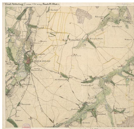
Mapa topograficzna Głogówka