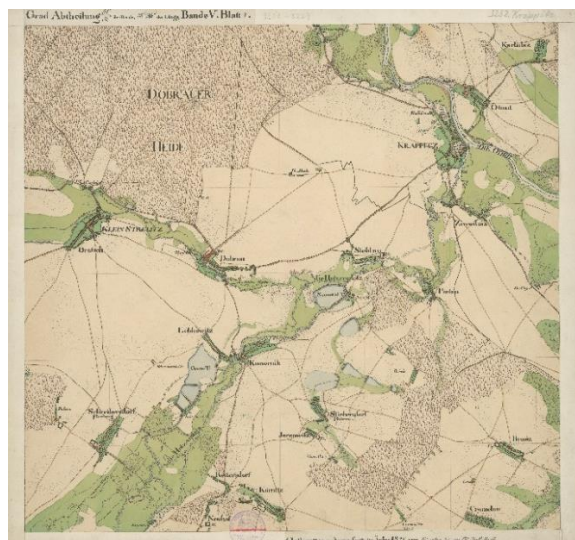
Mapa topograficzna Krapkowic

für den Kreis Neustadt/Oberschlesien. Die HKKNOS hat aus der Staatsbibliothek Berlin die Urmesstischblätter des Kreises Neustadt/OS in digitalisierter Form erworben. Wegen des dt. Urheberrechtes dürfen die Dateien aber nicht auf die Cloud der HKKNOS hochgeladen werden. Bei Interesse können wir (nach Speicherung der Kontaktdaten des Abnehmers) die Scans jedoch jederzeit zur Verfügung stellen.