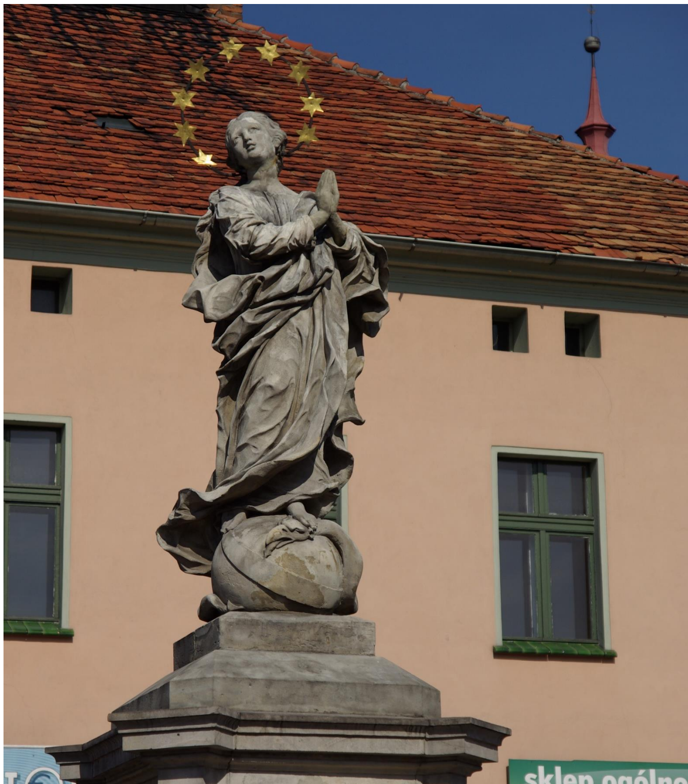
Ring Zülz / Rynek Biała

Historische Kommission für den Kreis Neustadt/OS e.V. Komisja Historyczna powiatu prudnickiego