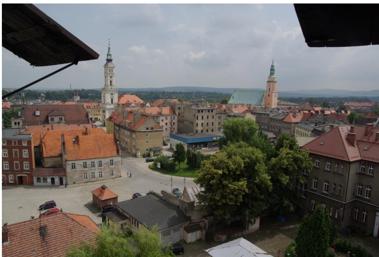
Blick auf Neustadt / Widok na Prudnik